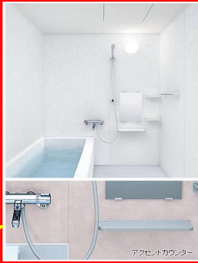
床表面に刻まれたパターンが水の流れを誘導。どどん水が引いていきます。

どどん水が引いて翌朝はカラリ！靴下で洗い場に入れます。 換気扇に頼らなくても床がカラリと乾くので、翌朝には靴下のままでも入ることができます。すべりにくいうえに、カビの発生源である浴室に残った水滴や水たまりをカラッと。カラリとすれば汚れも付きにくく、いつでも清潔に保てます。 カラリ床 ※換気や床の清掃、使用状況などの条件によっては、水が残ることがあります。 ※効果を維持するためにはお掃除が必要です。